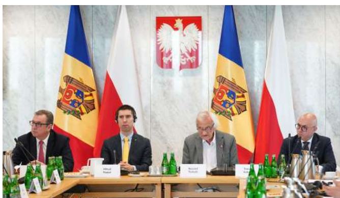
Varșovia, Republica Polonă