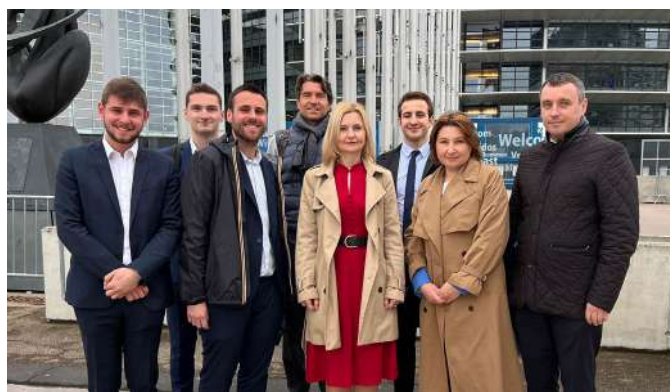
Paris, Republica Franceză