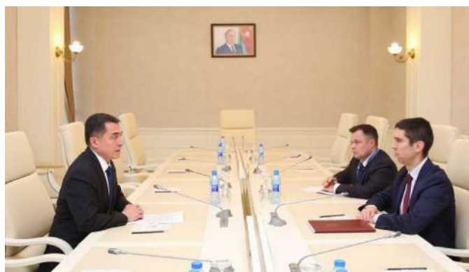
Baku, Republica Azerbaidjan

16.05 Președinta Comisiei politice externe și integrare europeană, Doina Gherman, a participat la ședința plenară a Conferinței organelor specializate în afaceri comunitare ale parlamentelor din Uniunea Europeană (COSAC). „Pentru a face față provocărilor și amenințărilor hibride, avem nevoie mai mult ca oricând de aliați puternici, iar Uniunea Europeană ne oferă sprijinul necesar. Rămânem optimiști privind viitorul nostru european în calitate de stat candidat și continuăm agenda de reforme”, a accentuat Doina Gherman.