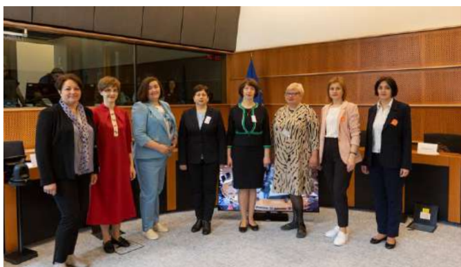
Strasbourg, Republica Franceză