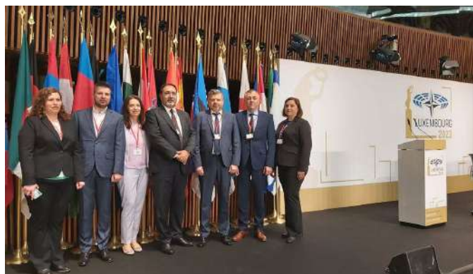
Luxemburg, Marele Ducat de Luxemburg

17.05 Vicepreședintele Parlamentului Republicii Moldova Mihail Popșoi a avut o întrevedere cu prim-vicepreședintele Parlamentului Republicii Azerbaidjan Ali Huseynli unde au discutat despre relațiile moldo-azere, perspectivele de consolidare a dialogului interparlamentar și situația din regiune, în contextul războiului din Ucraina.