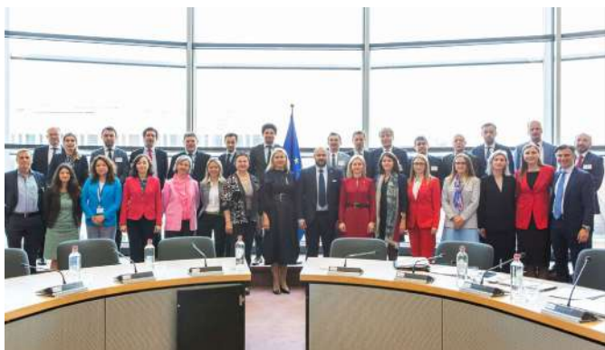
Bruxelles, Regatul Belgiei